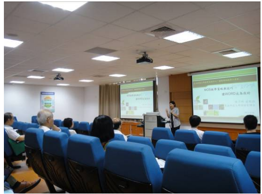
單元一講師證照輔導經驗分享