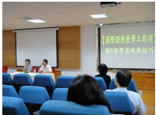
單元一、二經驗交流 Q & A