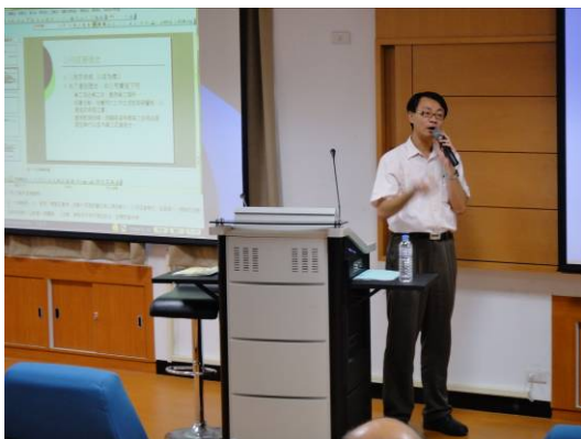
單元二講師證照輔導經驗分享