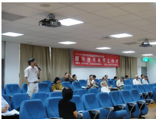
參加教師踴躍提問