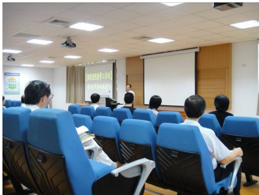
召集學校校長致詞