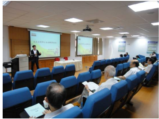
單元四講師證照輔導經驗分享