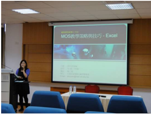
單元三講師證照輔導經驗分享