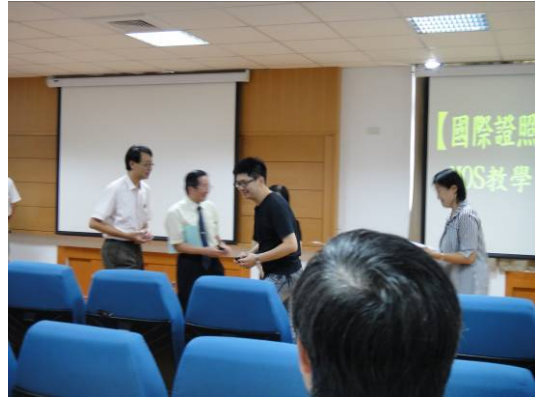
主持人與講者問候交流