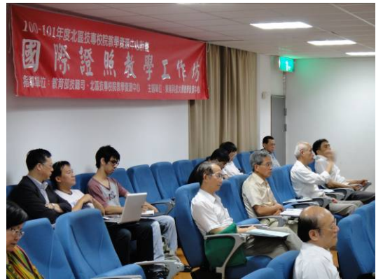
參加教師專注聽工作坊演講