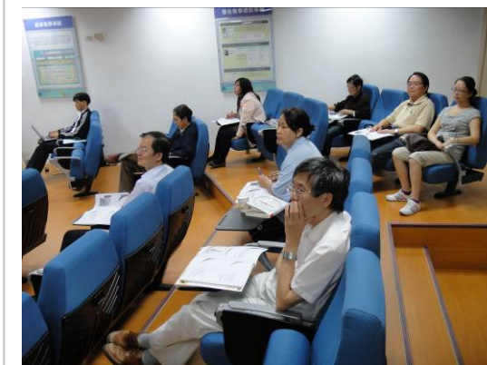
參加教師專注聽工作坊演講