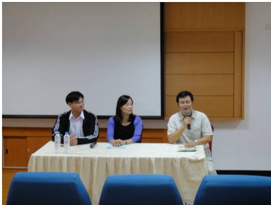
單元三、四經驗交流 Q & A